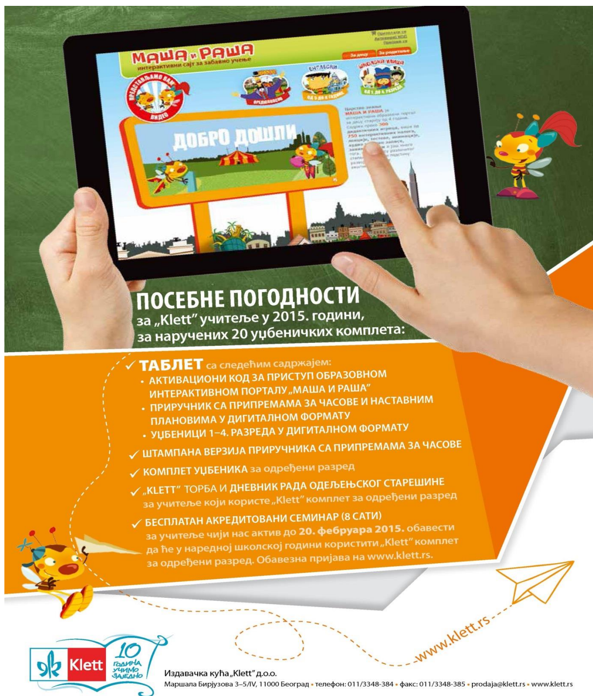
Slika 1: pogodnosti za nastavnike koji izaberu udžbenike